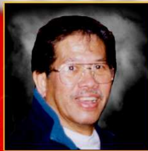
Gründer des Modern Arnis